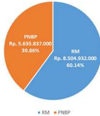
Pagu Puslatbang KHAN LAN Tahun 2023 Berdasarkan Sumber Anggaran

Berdasarkan program yang diamanatkan pada Puslatbang KHAN LAN, anggaran tersebut didistribusikan pada 2 program yaitu Program Dukungan Manajemen dan Program Kebijakan, Pembinaan Profesi, dan Tata Kelola ASN.