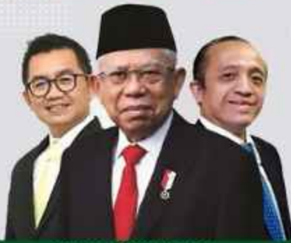
KH. MA'RUF AMIN