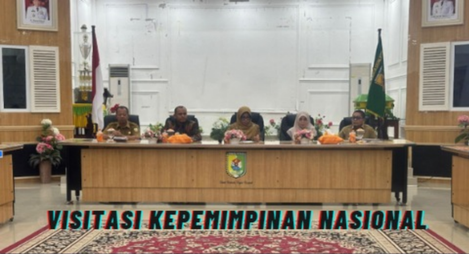
VISITASI KEPEMIMPINAN NASIONAL