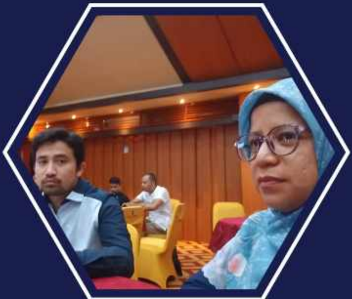
Sosialisasi Penyusunan Laporan keuangan Semester I