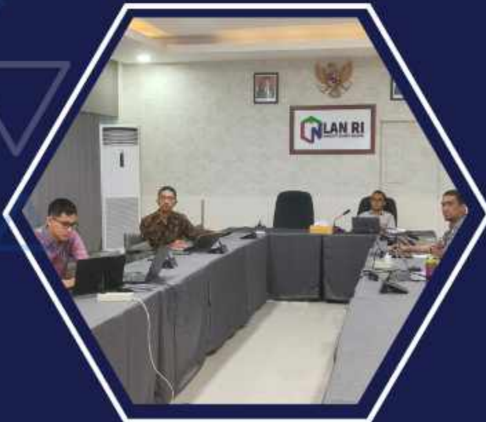
Diskusi Penjenjangan Kinerja Puslatbang KHAN