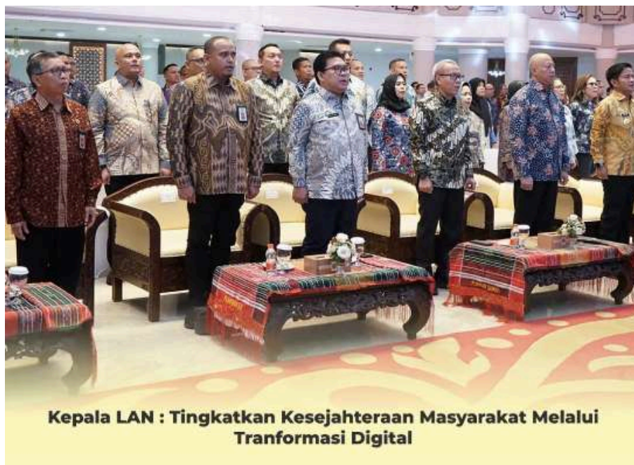
Kepala LAN : Tingkatkan Kesejahteraan Masyarakat Melalui Tranformasi Digital