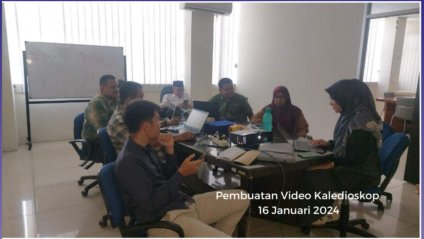
Pembuatan Video Kaledioskop 16 Januari 2024