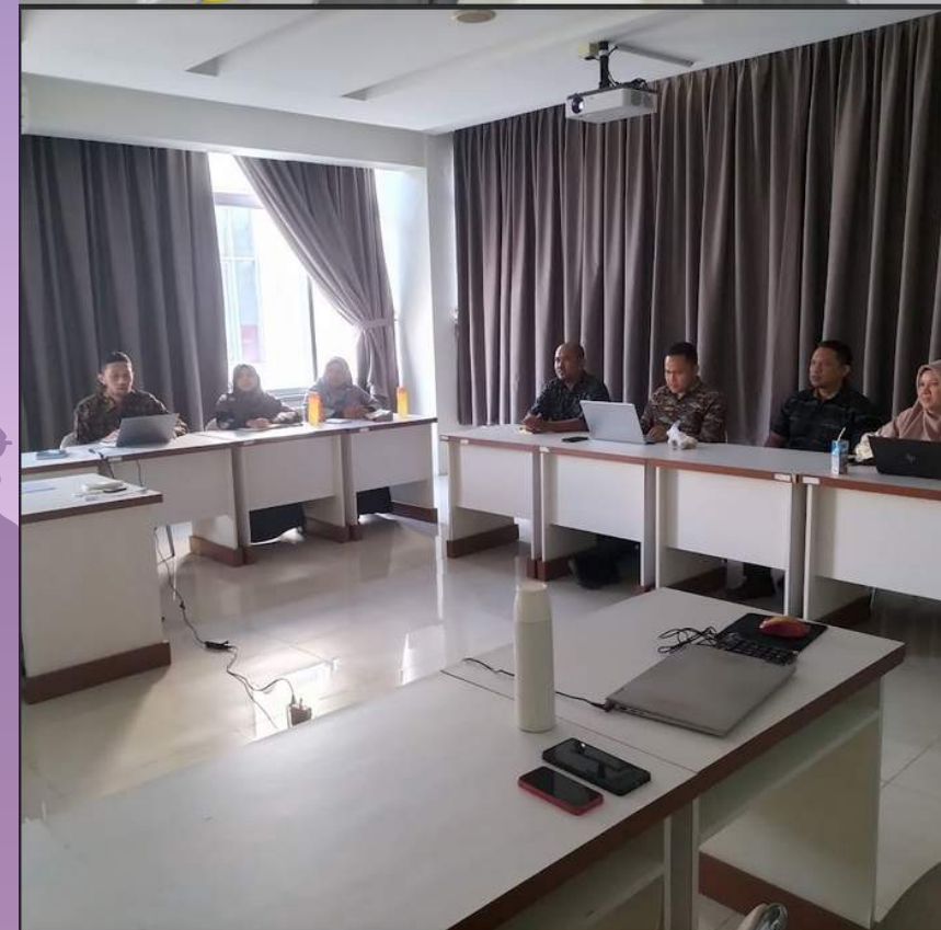
Rapat Pra-Raker Mandiri 4 s.d 5 Januari 2024