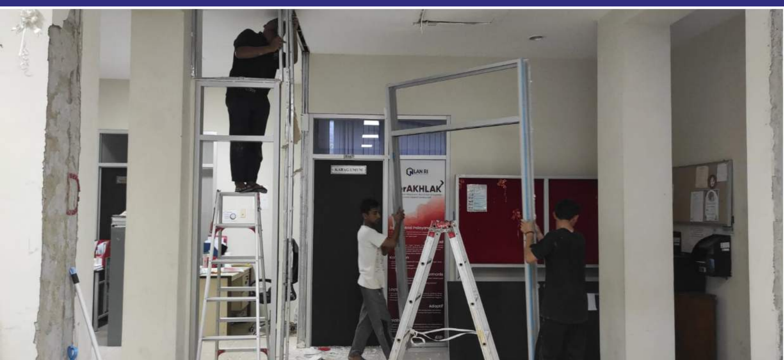
Penataan Ruang Kerja Minggu Pertama Januari 2024